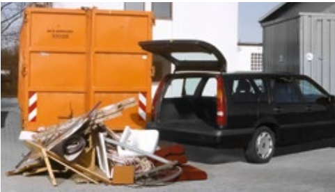
Das sind 2 Kubikmeter Sperrmüll

Wird eine der Mengenbegrenzungen überschritten, ist eine Teilabladung nicht gestattet. Haben Sie zum Beispiel 0,3 Kubikmeter Bauschutt dabei, dürfen Sie davon nicht 0,1 Kubikmeter abladen.