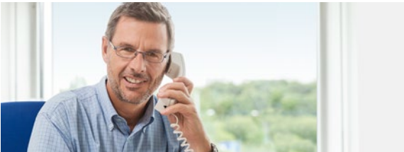
Ingenieur/-innen der Fachrichtungen Abfallwirtschaft, Bau, Maschinenbau und Umwelt sowie Architekten