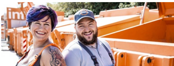
Fachkräfte und Meister/-innen für Kreislauf- und Abfallwirt- schaft und Chemietechniker/-innen