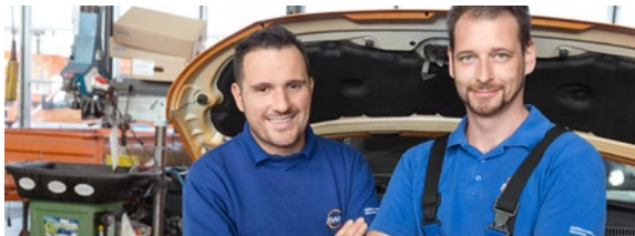
HLS-Meister/-innen, Metallbauschlosser/-innen und Fachkräfte für Elektrotechnik