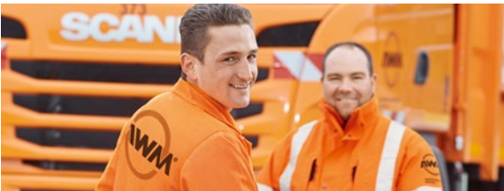
Mülllader/-innen und Kraftfahrer/-innen