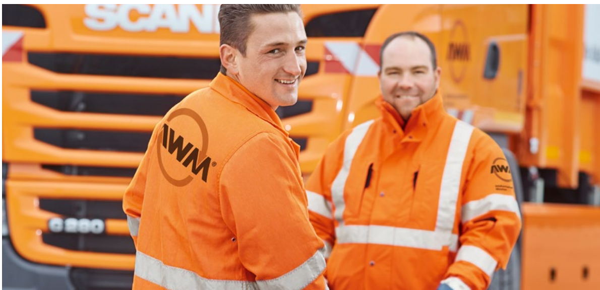
Wir im Einsatz.

Sie können Anzahl und Art der Tonnen nach Ihren Wünschen kombinieren. Wir stellen die Behälter kostenlos zur Verfügung, es entstehen keine Mietgebühren.